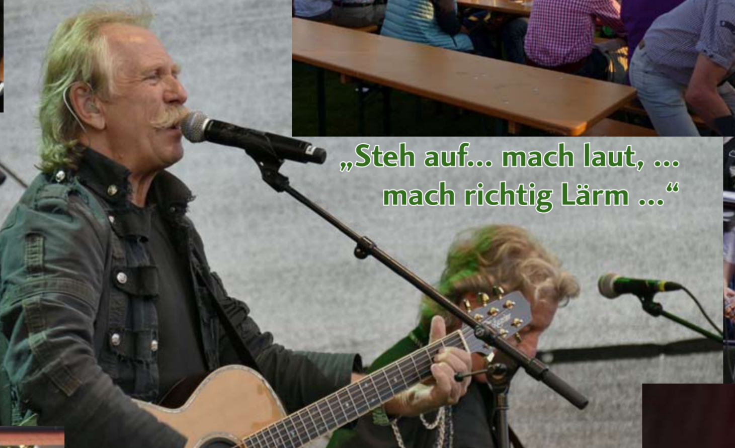
„Steh auf... mach laut, ... mach richtig Lärm ...“